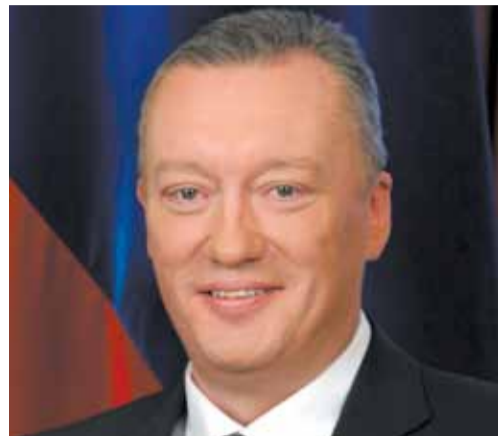
Вадим ТЮЛПАНОВ Секретарь Политсовета Санкт-Петербургского регионального отделения партии «ЕДИНАЯ РОССИЯ», председатель Законодательного собрания Санкт-Петербурга