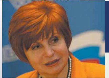
Валентина ИВАНОВА Председатель Всероссийского педагогического общества, член Высшего совета «ЕДИНОЙ РОССИИ» и Федерального координационного совета Общероссийского народного фронта