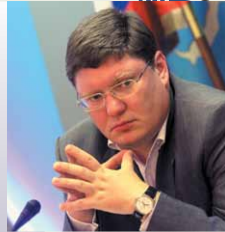
Андрей ИСАЕВ Первый заместитель секретаря Президиума Генерального совета партии «ЕДИНАЯ РОССИЯ»