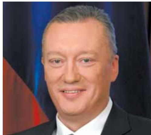
Вадим ТЮЛПАНОВ Секретарь Политсовета Санкт-Петербургского регионального отделения партии «ЕДИНАЯ РОССИЯ», председатель Законодательного собрания Санкт-Петербурга