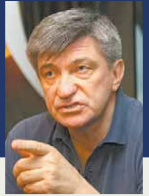
Александр СОКУРОВ Кинорежиссер