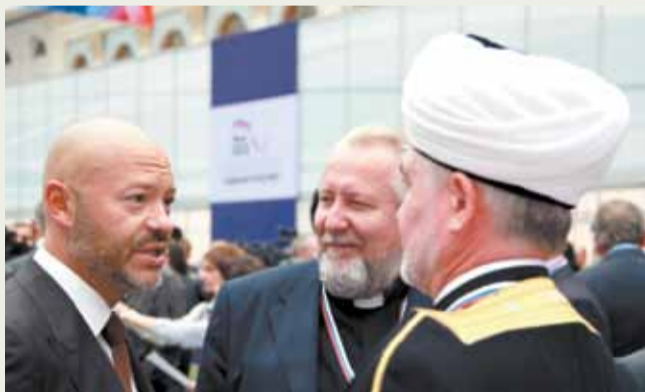
Федеральный список партии «ЕДИНАЯ РОССИЯ» по субъекту Российской Федерации «город Санкт-Петербург» (в скобках – позиция по общефедеральному списку)