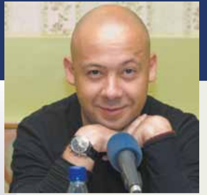
Алексей ГЕРМАН-младший, кинорежиссер