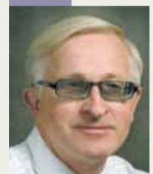
Александр ШОХИН, глава Российского союза промышленников и предпринимателей

Перспективы участия президента РФ Дмитрия Медведева и лидера партии Владимира Путина в руководстве Россией