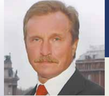
Алексей БЕЛОУСОВ депутат фракции «ЕДИНАЯ РОССИЯ» Законодательного собрания Санкт-Петербурга