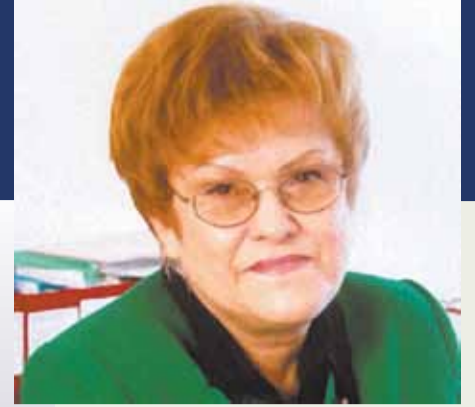
Людмила ВЕРБИЦКАЯ Президент Санкт-Петербургского университета, доктор филологических наук, советник губернатора Петербурга по образованию, науке и СМИ

Арабская поговорка «Терпение – прекрасно». Спокойное отношение к жизни и понимание его, что бы ни случилось, ты должен спокойно к этому относиться, – и есть красота жизни.