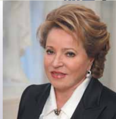
Валентина МАТВИЕНКО Губернатор Санкт-Петербурга, член Высшего совета партии «ЕДИНАЯ РОССИЯ»