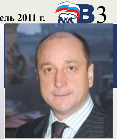
Владимир БАРКАНОВ Член Комитета по бюджету Совета Федерации