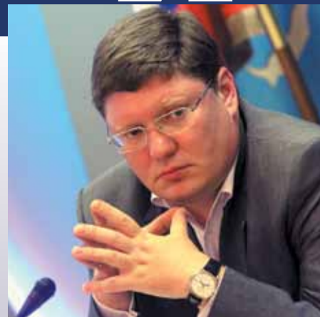
Андрей ИСАЕВ Первый заместитель секретаря Президиума Генерального совета партии «ЕДИНАЯ РОССИЯ», глава Комитета по труду и социальной политике Государственной думы РФ